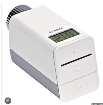
Slimme radiator kraan